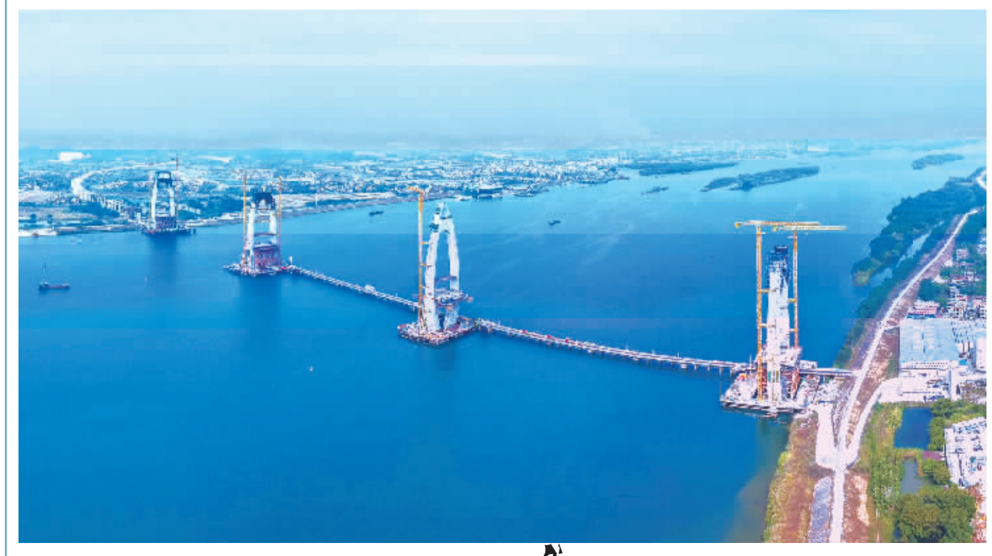
这是12月25日拍摄的清花高速北江特大桥封顶的主塔(右二)(无人机) 日 大桥 的清(清)清新)花(花)高速北江特大桥主塔封顶 清花高速北江特大桥

会议提出,2025年,要持续用力推动房地产市场止跌回稳。着力释放需求。把“四个取消、四个降低、两个增加”各项存量政策和增量政策坚决落实到位,大力支持刚性和改善性住房需求。有效发挥住房公积金支持作用。加力实施城中村和危旧房改造,推进货币化安置,在新增100万套的基础上继续扩大城中村改造模,消安全、改善住。对众改造意强、比成、的项目重支持。着力改善。 A02